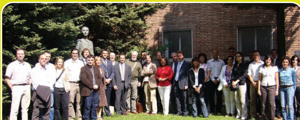
Integrantes del Proyecto NANOSOST junto a la imagen de San Ignacio en IQS

El Ministerio de Ciencia e Innovación aprobó en 2008 el proyecto NANOSOST, cuyo lema es "hacia una nanotecnología sostenible, responsable y segura" y que está promovido y coordinado desde el Departamento de Ingeniería Química del IQS.