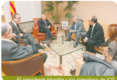
El presidente Montilla y los miembros de IQS