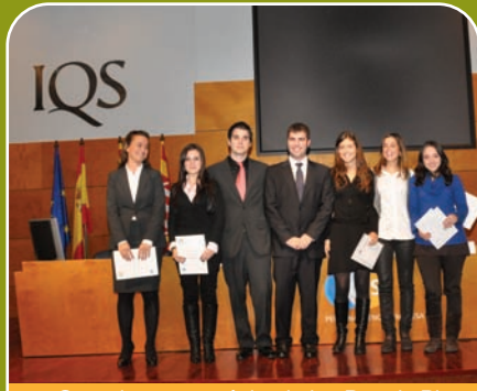
Ganadores y accésits de los Premis Pla d'Empresa IQS

En noviembre de 2008 se dieron a conocer los ganadores de los Premis Pla d'Empresa IQS para los alumnos de 5º curso de ADE e Ingeniería Industrial del IQS.